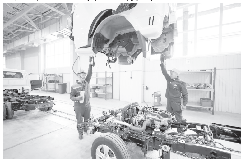
Продолжение в следующем номере.

Хороший рост в 2023 году дала отрасль "Производство компьютеров, электронных и оптических изделий". В этой отрасли рост во многом определяется такими факторами, как проведение СВО, антироссийская санкционная политика, а также рост количества и качества инновационных разработок ульяновских компаний. Мы традиционно входим в топ-10 страны по инновационному развитию. Наши предприятия - Ульяновский механический завод, завод "Искра", НПО "Марс", УКБП - крупнейшие поставщики авионики в другие регионы России.