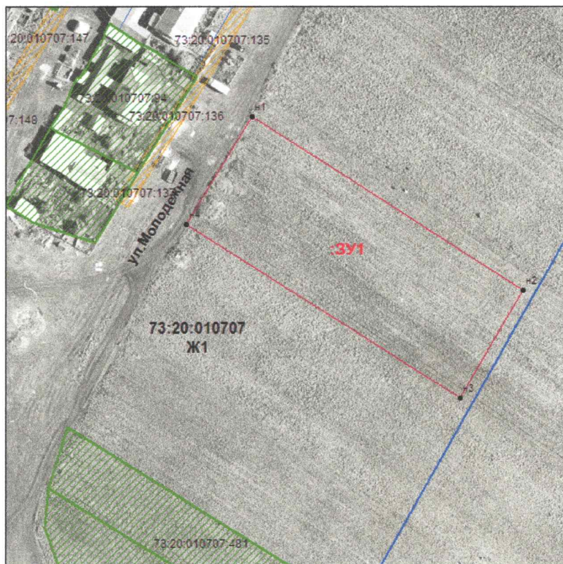
Схема на КПТ