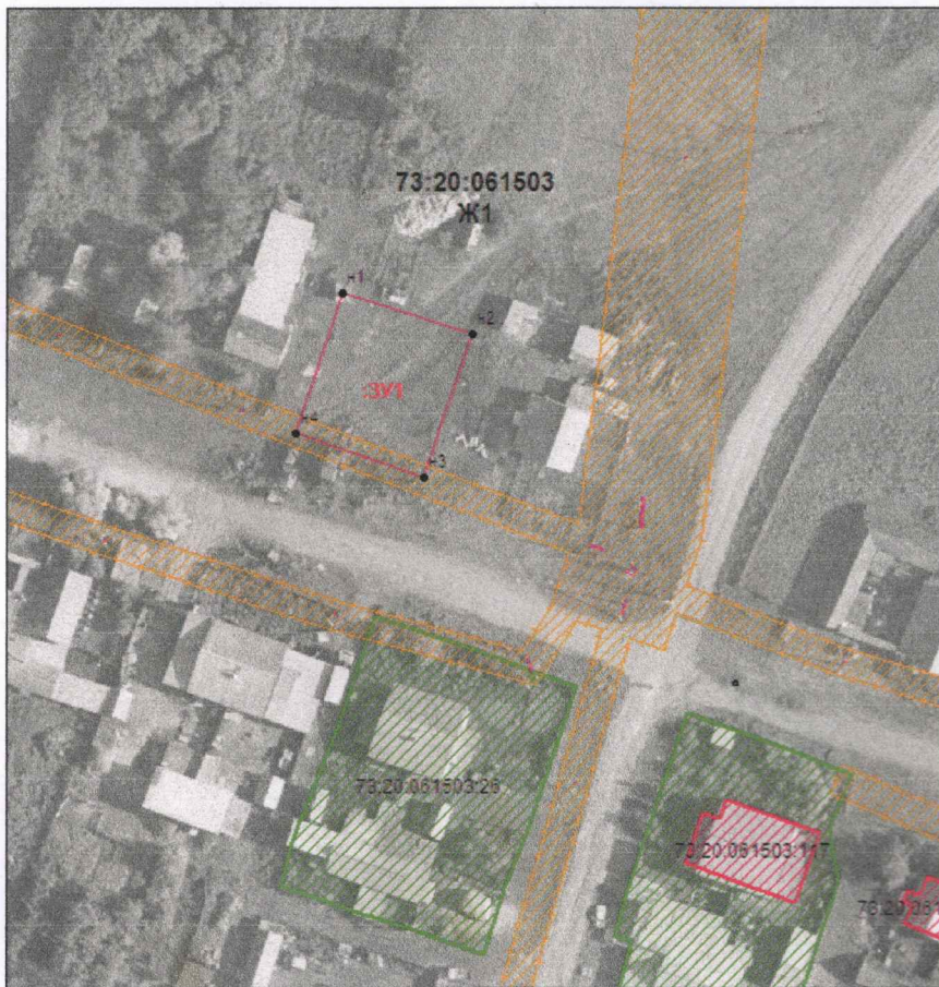
Схема на КПП