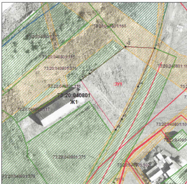
Схема на КПП