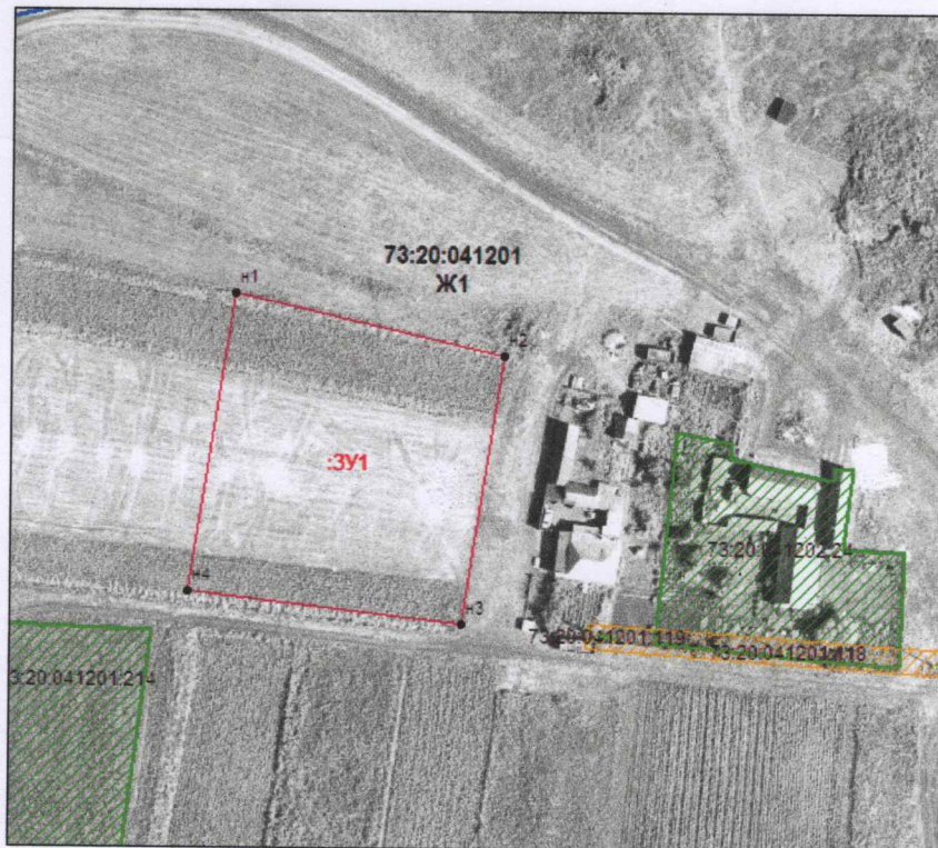
Схема на КПП